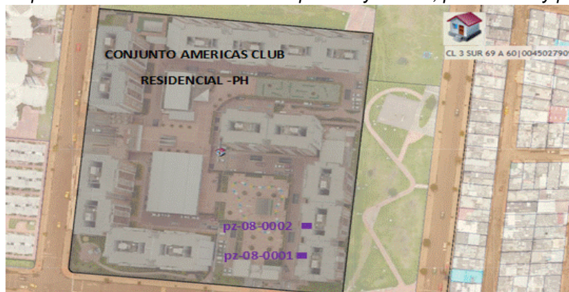
Imagen No. 1. Ubicación del pozo pe-08-0001 y pe-08-0002.

A continuación, se presenta la ubicación de los dos pozos eyectores, pe-08-0001 y pe-08-0002.